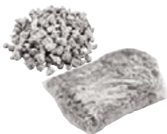
Spezialgranulat 1,50 kg Art.-Nr. 21824