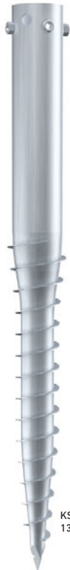
KSF G 114x 1300-4xM16