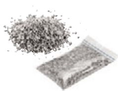
Spezialgranulat 0,50 kg Art.-Nr. 21823