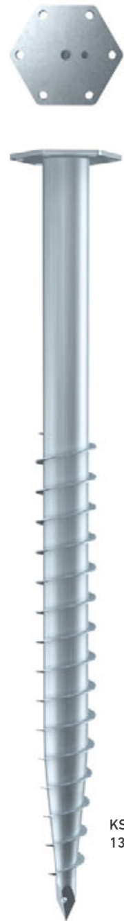
KSF M 76x 1300-M16