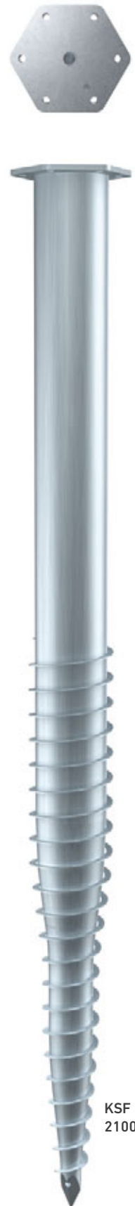
KSF M 140x 2100-M24